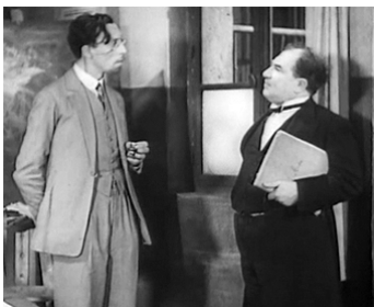
1933 TOPAZE de Louis Gasnier avec Louis Jouvet