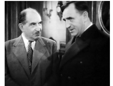
1942 HAUT-LE-VENT de Jacques de Baroncelli avec Charles Vanel