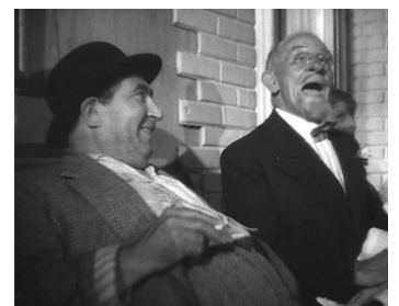
1937 L'HOMME DU JOUR de Julien Duvivier avec Sinoël