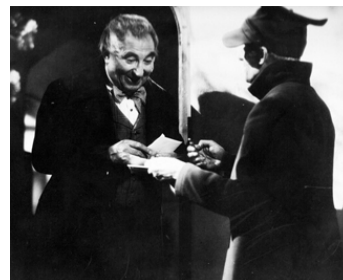
1934 LA CHANSON DE L'ADIEU d'Albert Valentin & Geza von Bolvary avec Jean Servais