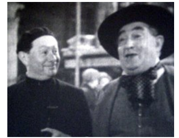
1938 MON CURÉ CHEZ LES RICHES de Jean Boyer avec Bach