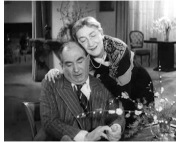
1938 LES FEMMES COLLANTES de Pierre Caron avec Marguerite Moreno