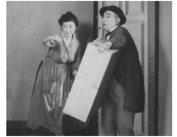
1923 PAR HABITUDE d'Henri Diamant-Berger avec Pauline Carton