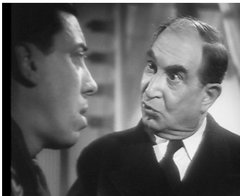
1941 LE CLUB DES SOUPIRANTS de Maurice Gleize avec Fernandel