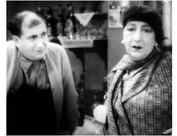
1930 PARIS LA NUIT d'Henri Diamant-Berger avec Marguerite Moreno