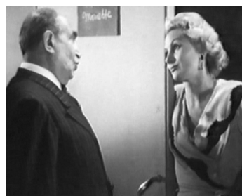
1953 QUAND TE TUES-TU ? d'Émile Couzinet avec Gaby Bruyère