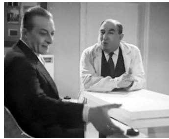
1937 RENDEZ-VOUS CHAMPS-ÉLYSÉES de Jacques Houssin avec Jules Berry