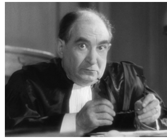
1938 BELLE ÉTOILE de Jacques de Baroncelli