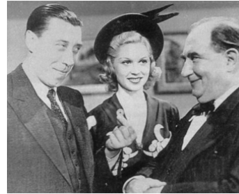
1939 LES CINQ SOUS DE LAVARÈDE de Maurice Cammage avec Fernandel, Josette Day