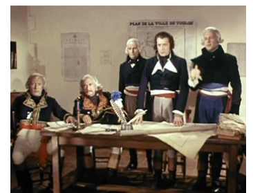
1955 NAPOLÉON de Sacha Guitry avec Félix Clément