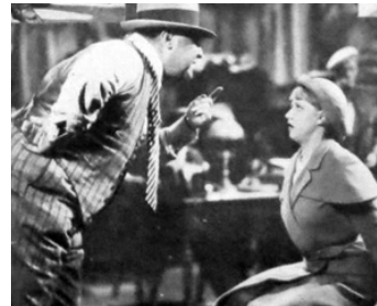
1932 MIRAGES DE PARIS de Fedor Ozep avec Jacqueline Francell