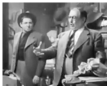
1935 DIVINE de Max Ophüls avec Paul Azaïs