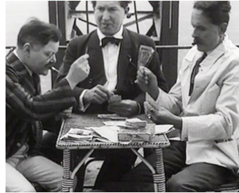
1925 PARIS QUI DORT de René Clair avec Antoine Stacquet, Louis Pré Fils