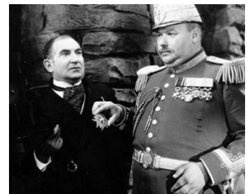
1934 LA VEUVE JOYEUSE d'Ernst Lubitsch avec André Berley