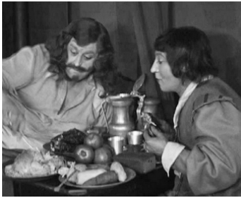
1921 LES TROIS MOUSQUETAIRES d'Henri Diamant-Berger avec Charles Martinelli