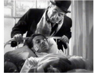
1939 LE DERNIER TOURNANT de Pierre Chenal avec Fernand Gravey