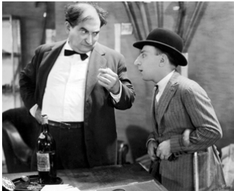
1932 LE CORDON BLEU de Karl Anton avec Pilouto