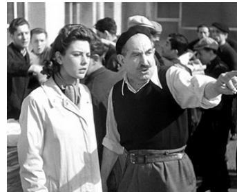
1942 LE JOURNAL TOMBE À CINQ HEURES de Georges Lacombe avec Marie Déa