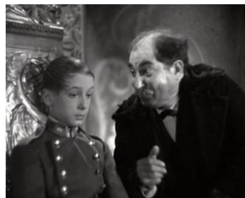
1933 LE PETIT ROI de Julien Duvivier avec Robert Lynen