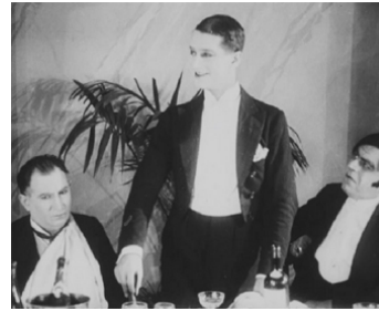
1923 L'AFFAIRE DE LA RUE DE LOURCINE d'Henri Diamant-Berger avec M. Chevalier