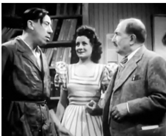
1946 CŒUR DE COQ de Maurice Cloche avec Fernandel, Gisèle Alcée