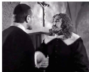
1947 MONSIEUR VINCENT de Maurice Cloche avec Pierre Fresnay