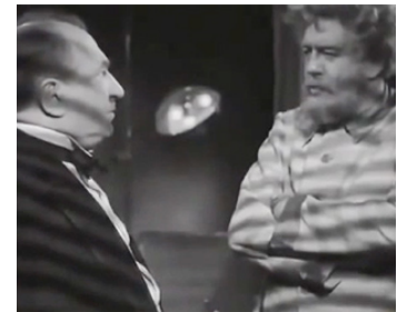
1940 LA COMÉDIE DU BONHEUR de Marcel L'Herbier avec Michel Simon