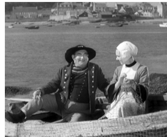
1940 BÉCASSINE de Pierre Caron avec Paulette Goddard