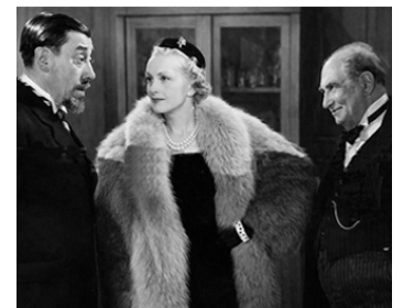
1950 TOPAZE de Marcel Pagnol avec Fernandel, Hélène Perrière