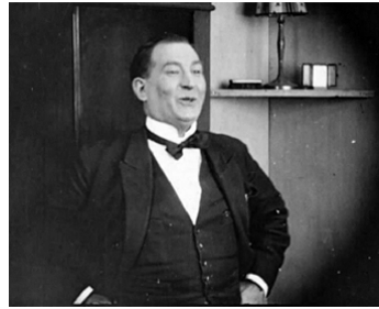
1922 GONZAGUE ou L'ACCORDEUR d'Henri Diamant-Berger