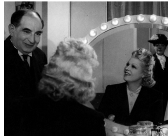
1942 LE VOILE BLEU de Jean Stelli avec Elvire Popesco